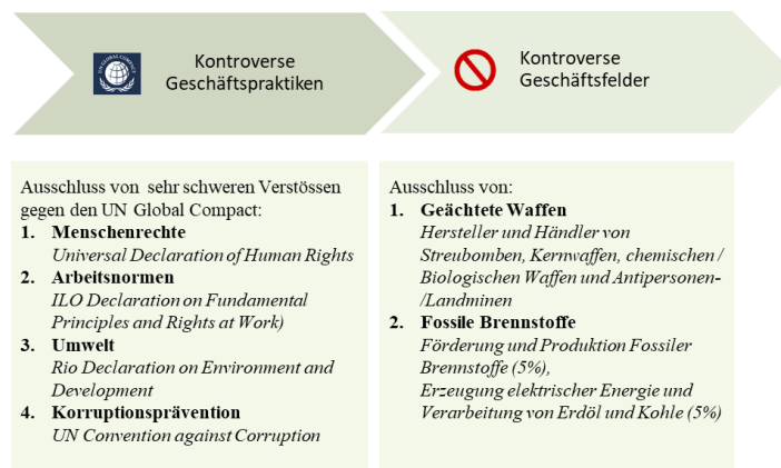
Abbildung: Generelle Ausschlüsse zur Ermittlung des BEKB Anlageuniversums

In einem weiteren Schritt werden im Rahmen einer ESG-Integration Nachhaltigkeitskriterien systematisch in den Anlageprozess eingebunden, um der konventionellen Finanzanalyse eine zusätzliche Dimension zu verleihen. Dabei werden im Rahmen einer ESG-Analyse Emittenten auf deren Risiken und Chancen im Bereich Umwelt, Soziales und Governance, deren Management von Klimarisiken sowie deren Verwicklung in kontroverse Geschäftspraktiken analysiert. Als Basis dienen die beiden Kennzahlen "ESG Performance Score" und ein "Carbon Risk Rating", welche durch ISS ESG ( www.issgovernance.com/esg-de ) auf Emittentenebene ermittelt werden.