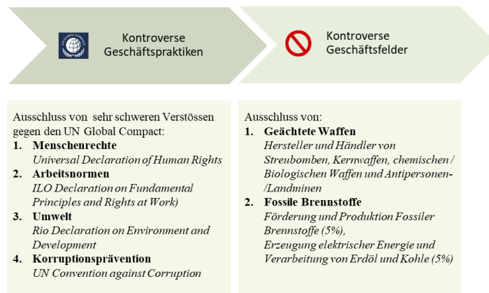
Abbildung: Generelle Ausschlüsse zur Ermittlung des BEKB Anlageuniversums

In einem weiteren Schritt werden im Rahmen einer ESG-Integration Nachhaltigkeitskriterien systematisch in den Anlageprozess eingebunden, um der konventionellen Finanzanalyse eine zusätzliche Dimension zu verleihen. Dabei werden im Rahmen einer ESG-Analyse Emittenten auf deren Risiken und Chancen im Bereich Umwelt, Soziales und Governance, deren Management von Klimarisiken sowie deren Verwicklung in kontroverse Geschäftspraktiken analysiert. Als Basis dienen die beiden Kennzahlen "ESG Performance Score" und ein "Carbon Risk Rating", welche durch ISS ESG ( www.issgovernance.com/esg-de ) auf Emittentenebene ermittelt werden.